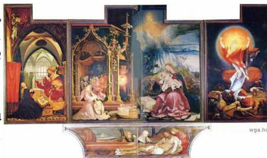
Второй вид алтаря (раскрытый).

https://www.youtube.com/watch?v=Sd3hvhnd7YU